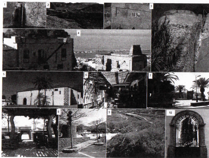
Figura 2.- Recursos seleccionados para la confección del itinerario de geoturismo urbano de Adeje. Los números poseen su correspondencia en el tabla 1

disponerse en la periferia del casco municipal en su sector norte y este. Por el contrario, los recursos asociados al patrimonio tangible inmueble se ubican en el interior siguiendo una clara trayectoria norte-sur. Este aspecto es fundamental para diseñar potenciales itinerarios geoturísticos en el casco urbano o en sus inmediaciones, en función del tipo de recurso o las preferencias del visitante.